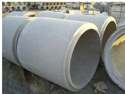
Tubos de alcantarillado de diferentes medidas