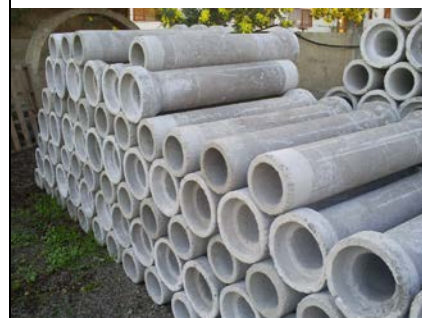
Tubos de alcantarillado de diferentes medidas