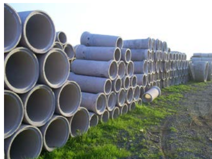
Tubos de alcantarillado de diferentes medidas