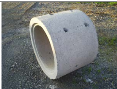
Tubo para Pozo con perforaciones con fierro